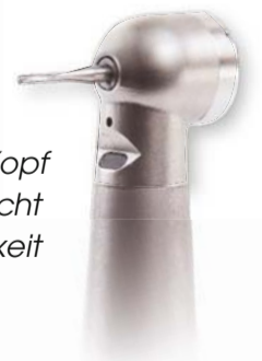
Legacy 5 Mini-Kopf für hervorragende Sicht und Zugänglichkeit