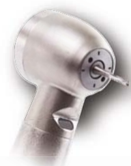
Legacy 5 Standard- Kopf mit 4 Port Spray